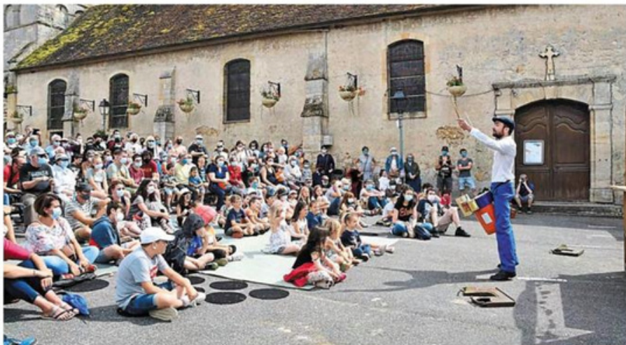
Petits et grands sur la place de l'Église lors de l'ouverture du festival Hurlu Belles Rues.

Ce dimanche, le festival Hurlu Belles Rues continue. Au programme dès 10 h, en même temps que l'ouverture du marché à l'ancienne où vous